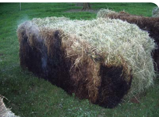
Nicht nur Heustöcke können sich selbst entzünden – auch bei Ballen besteht die Gefahr.