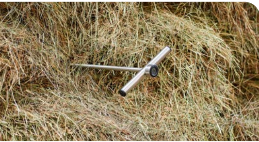
Messung der Kerntemperatur des Heustocks.