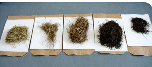
Durch mikrobielle Aktivität kann sich frisch eingelagertes Dürffutter bis hin zur Selbstentzündung erwärmen.

Mit steigender Temperatur bilden sich brennbare Gase. Ab ca. 70 °C entstehen Glimmbrände, die bei Sauerstoffkontakt in offene Brände übergehen können.