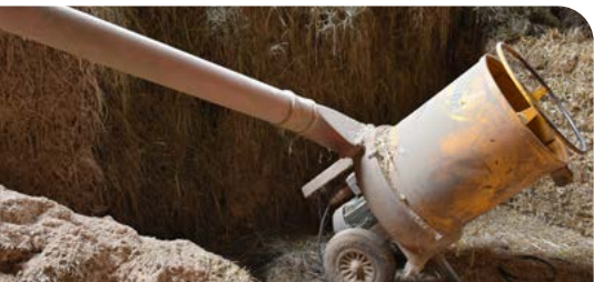
Fremdkörper wie Steine können in der Strohmühle zu Funkenbildung führen.