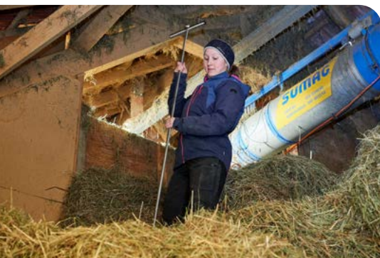
Regelmässige Überwachung der Temperatur mit einer langen Heumesssonde an mehreren Messpunkten bis zum Abschluss der Gärung.