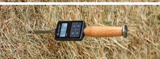
Je nach Temperaturanstieg sind kürzere Messintervalle bis hin zur Alarmierung der Feuerwehr erforderlich.