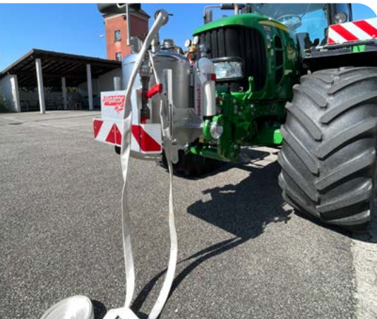
Die mobile Löschanlage Alligator 130 fasst 130 Liter Wasser und Schaummittel und gewährleistet im Brandfall eine rasche Intervention. Bezugsquelle: Fiechter Lohnunternehmung, Kappelen