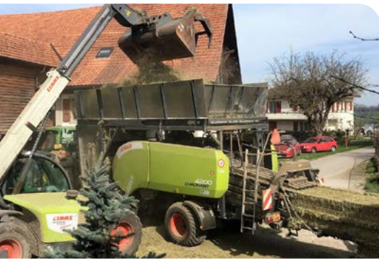
Der Pressvorgang sollte grundsätzlich immer ausserhalb von Gebäuden stattfinden.