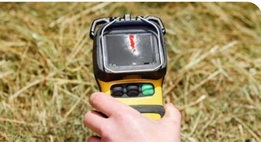
Eine Wärmebildkamera gibt Überblick über Luftströme und Oberflächentemperaturen. Sie gibt jedoch keinen direkten Einblick über Vorgänge im Kern des Heustocks.