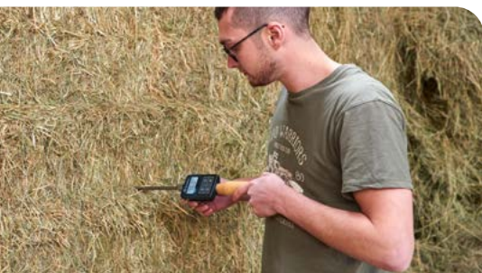
Kurze Handmesssonden sind geeignet, um die Temperaturentwicklung in Ballen zu überwachen.